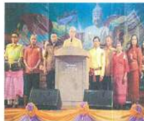
โครงการจัดงานสืบสานประเพณีวันลอยกระทง