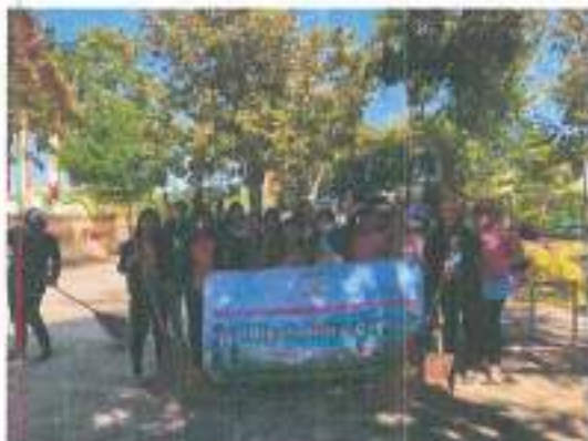
โครงการตำบลโพนค้อนำอยู่ เมืองสะอาด ชีวิตมีสุข (Big Cleaning Day)